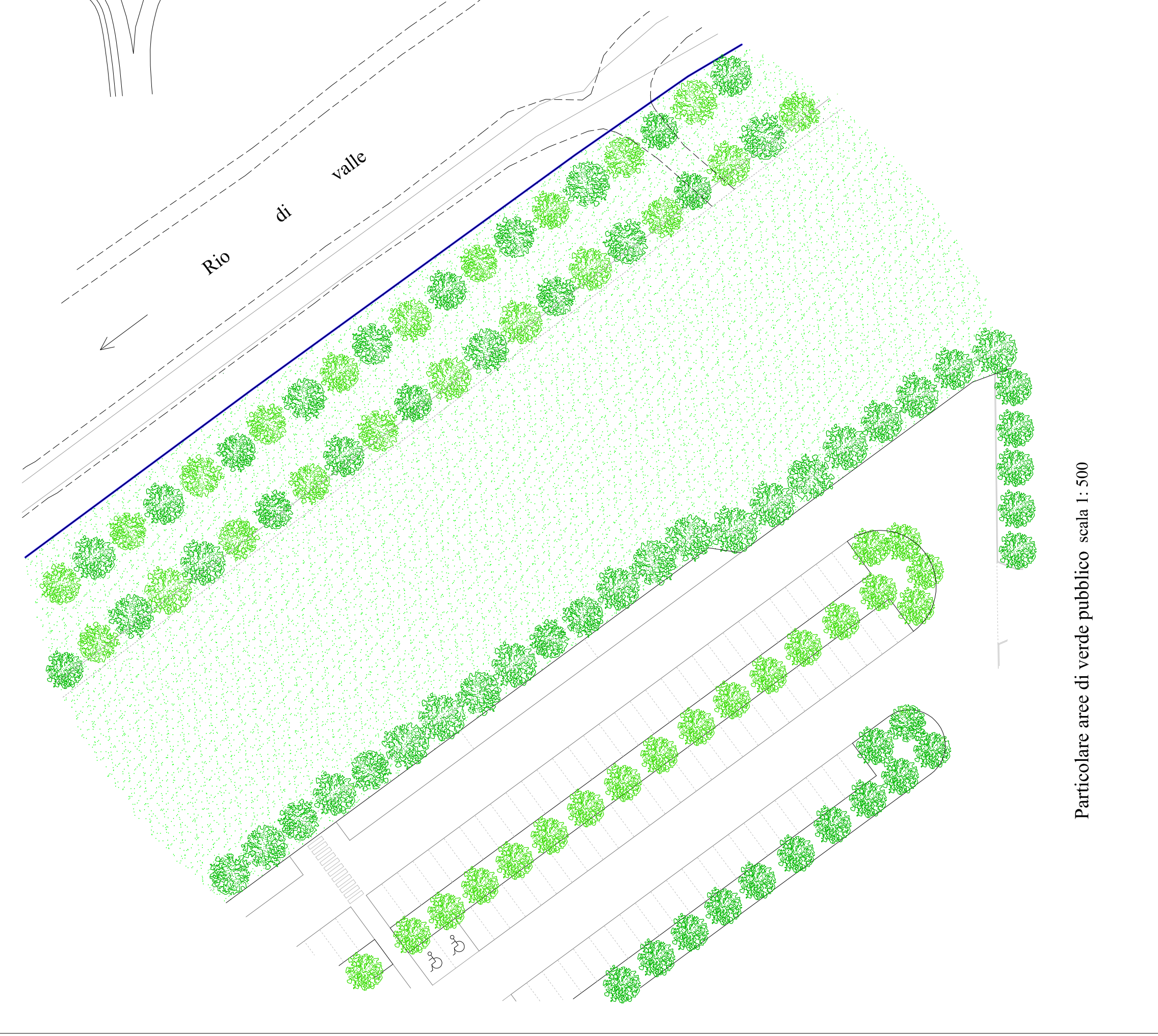
Particolare aree di verde pubblico scala 1: 500