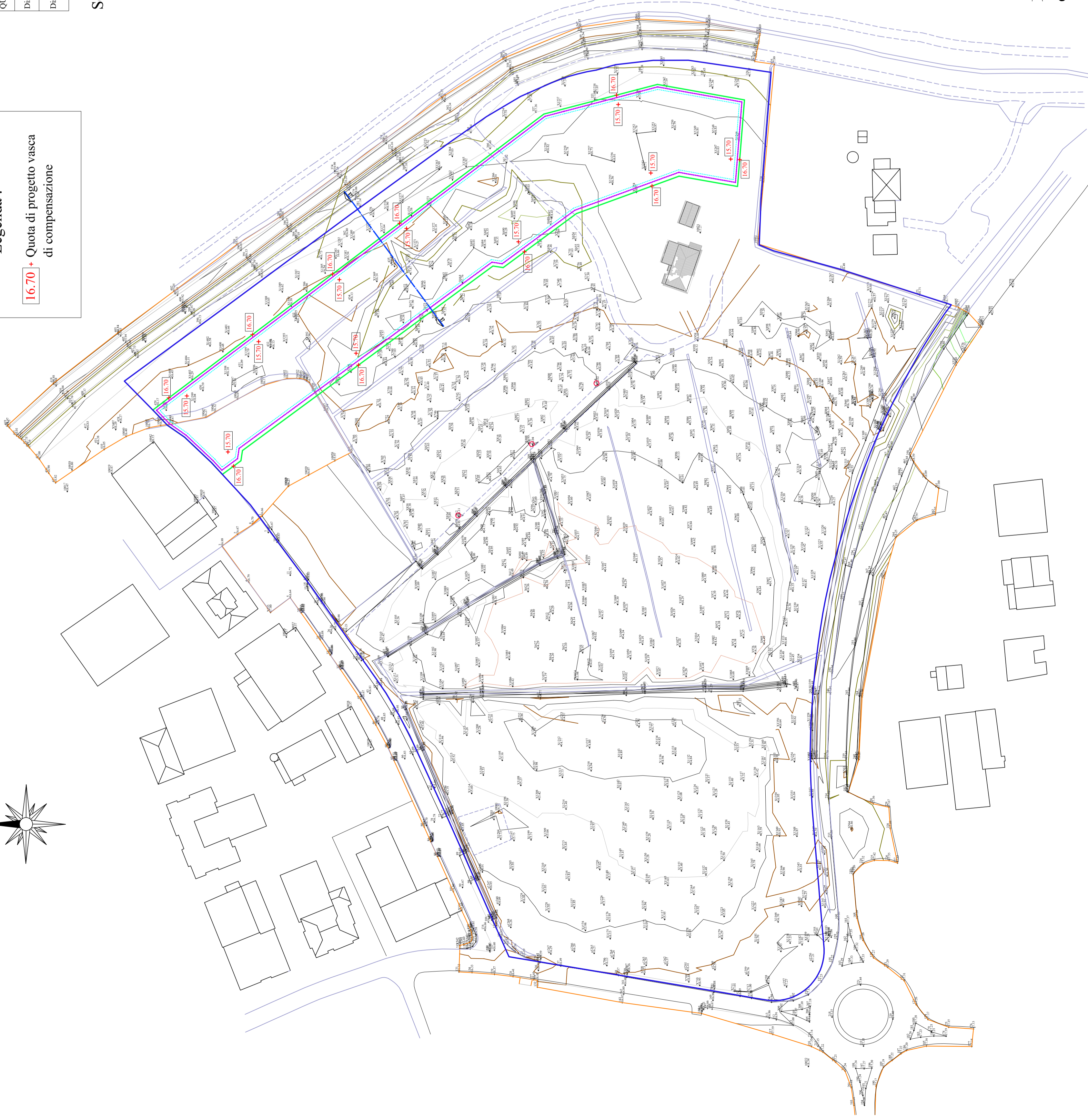
Planimetria con quote stato attuale scala 1:1,000

Legenda : 16.70 + Quota di progetto vasca di compensazione