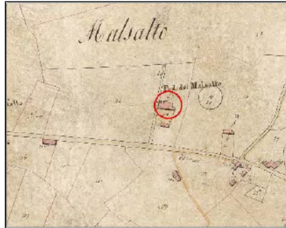
Estratto Catasto 1824: