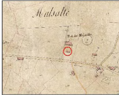
Estratto Catasto 1824: