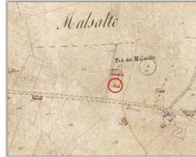
Estratto Catasto 1824: