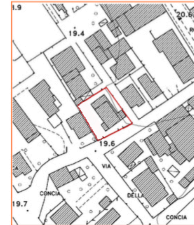
Estratto cartografico (scala 1:1500)